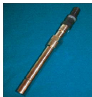
Figura 2. Sonda per analisi in trasmittanza