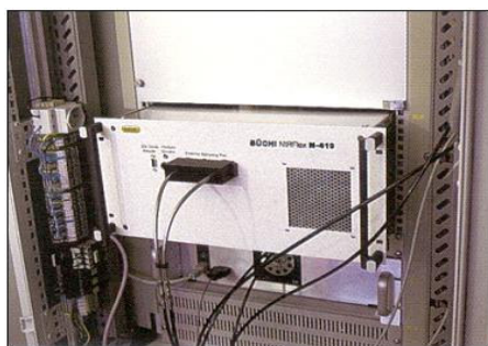
Figura 1. Spettrometro Büchi NIRFlex N-419

Attualmente, presso l'azienda produttrice di coloranti naturali SICNA, è stata invece sperimentata con successo una metodica basata sulla Spettroscopia NIR. Questa tecnica, calibrata sulla base dei dati di riferimento ottenuti col colorimetro, consente, tramite una sonda a fibre ottiche collegata a uno spettrometro FT-NIR per analisi on-line, di monitorare l'andamento del processo direttamente sulla linea di produzione.